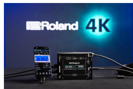
専用コントロール・アプリ 使用イメージ

※ 製品画像は、ニュースリリース・ページ https://www.roland.com/jp/news/1200/ よりダウンロードいただけます。