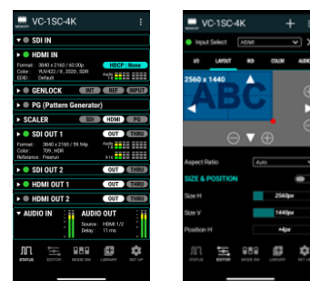
専用コントロール・アプリ 画面イメージ

入出力信号の状態確認やスケーリング設定を、直感的に操作できる無償の専用コントロール・アプリを用意。iOS、Android、iPadOS、macOS、Windowsに対応し、USB Type-C接続でスマートフォンやPCから操作が行えます。設定の保存・共有にも対応し、複数台の機器を使用する現場でのセットアップや調整作業の効率化に貢献します。