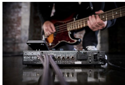
『GX-10』ベースとの接続 イメージ 「BT-DUAL」を装着