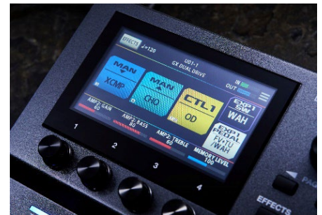
『GX-10』 カラー・ディスプレイ部

『GX-10』は、タッチ操作に対応するカラー・ディスプレイと 4 つのノブを組み合わせることで、スムーズな音作りを実現しています。ディスプレイ上に表示されるアイコンをタッチして選択、ドラッグ&ドロップで直感的に移動、細かなパラメーターの調節はノブでの操作が最適です。エフェクト・チェーンでは、最大 2 つのプリアンプ、15 種類のエフェクトを同時に使用することができます。さらにディバイダー機能により、エフェクトの直列／並列接続を切り替えることも可能です。「キャビネット IR データ」の取り込みや、SEND/RETURN による外部ペダルの接続にも対応しています。