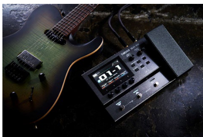
『GX-10』ギターとの接続 イメージ