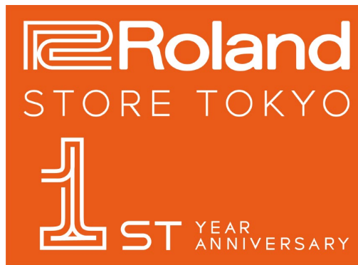
『Roland Store Tokyo 1st Year Anniversary Event』ロゴ

Roland Store Tokyo は、シンセサイザー、電子ピアノ、ギター関連製品など、当社の最新の電子楽器を取り扱う国内初出店となる直営店で、2023年10月のオープン以来、国内外から多くのお客様に会場にいらしています。楽器をよりよい環境で体験し、音楽を創造する楽しさを存分に味わっていただくために、豊富な知識と経験を有する「ローランド・プロダクト・スペシャリスト」が在籍。事前予約制によるお客様1人ひとりのご要望に沿った対応で好評をいただいています。