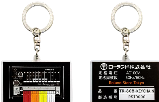
オリジナルの「TR-808」デザイン・キーホルダー 表／裏面 (期間限定で名入れサービスを実施)