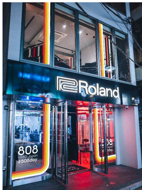
「TR-808」カラーのデコレーションを施した Roland Store Tokyo のイメージ