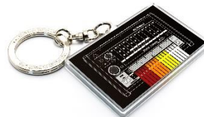
オリジナル・キーホルダー表面

また、このキーホルダーはアーティスト・グッズのブランド「The Music」による、「ミュージック・キーホルダー」です。スマートフォンにかざすと、ブラウザ上で「TR-808」のサウンドを使って楽曲制作が行えるウェブサイト「Roland 50 Studio」が表示され、気軽に「TR-808」サウンドを体験いただけます。