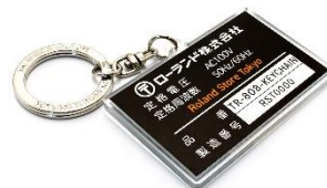
オリジナル・キーホルダー裏面