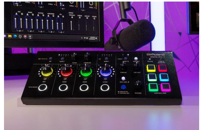
新製品「BRIDGE CAST X」をいち早く展示