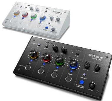
「BRIDGE CAST」(下)と アイスホワイト・カラーの「BRC-WH」

また、e スポーツイベントの会場演出や配信で使われているスイッチャー「V-160HD」、ゲームの見どころをクローズアップするリプレイヤー「P-20HD」、映像／音声と連動した照明演出を実現するコンバーター「VC-1-DMX」などをお試しいただけます。